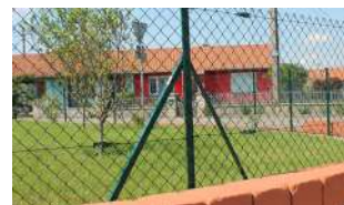
- Jambe de force L