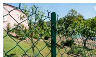
- Grillages simple torsion