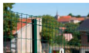
P.30 - Grillages soudés